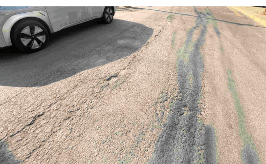
部分道路破裂严重