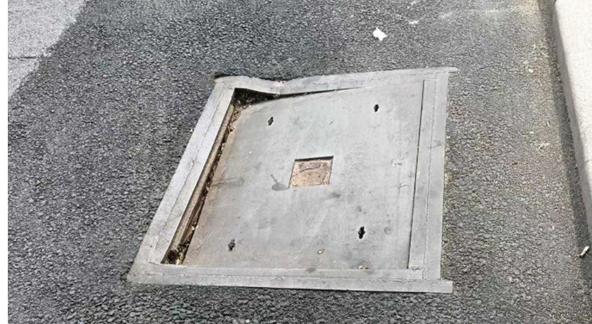
河东区津塘路塌陷井盖