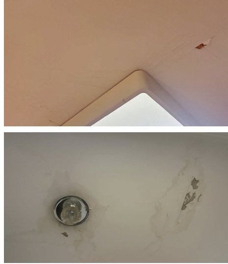
部分居民家吊顶布满深色水痕,墙皮受潮起鼓、脱落,霉斑明显。

使用维修资金须满足一系列法定条件。然而,小区实际入住率不足60%,大量业主长期在外,部分房屋出租后租户无法代签。工作人员只能