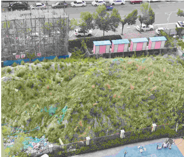
从楼上俯视大土堆

6月4日上午,记者来到西青道南侧的西青医院公交站,找到了市民提及的公交站牌。这个站牌风格古香古色,上面有4条公交线路的信息。记者对照公交官方软件查询相应线路信息,发现这4条线路信息都有错误。比如,153路现为2元一票制,并不是站牌上所写的1.5