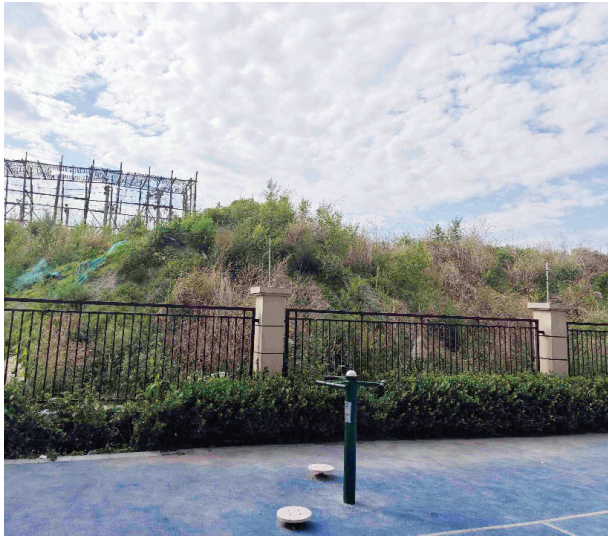
小区外的大型土堆

记者随居民来到3号楼附近,发现污水井井盖半掩着,从井里伸出一根排水管道向小区外。记者注意到,现场一台抽水