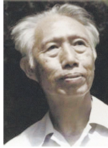
张肖虎教授 (1914—1997), 中国音乐学院前副院长。