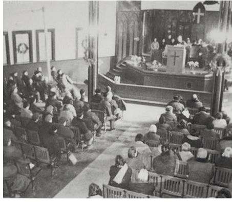
维斯理堂的小礼堂