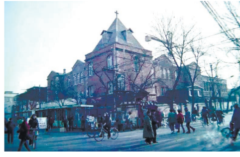
位于滨江道上的维斯理堂里的培才幼稚园和培才小学