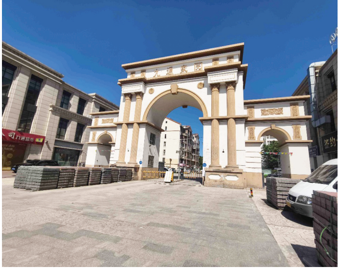
九通家园小区门口堆放大量面包砖

小区路面为何迟迟不恢复?带着问题,记者来到负责九通家园的静海区朝阳街禧顺佳园居委会,居委会一位工