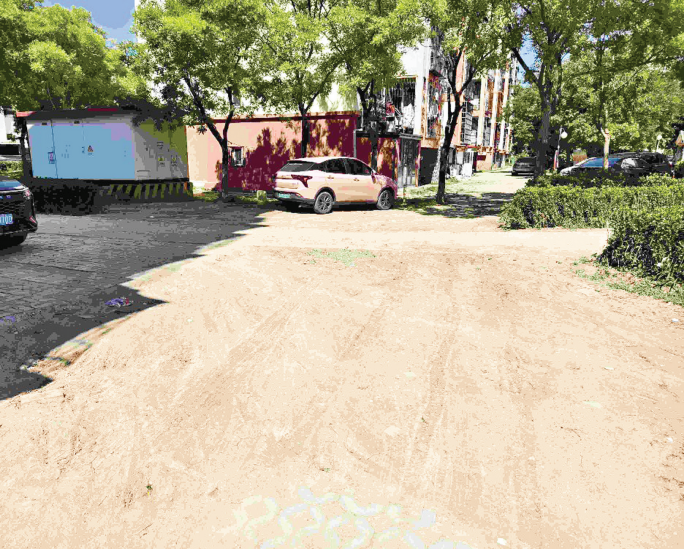
晴天路面尘土随处可见