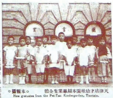
培才幼稚园毕业照片

这些大科,很重视体、音、美这些小科。从低年级一直到六年级毕业班,都开设这些体、音、美的课程,还有劳作,就是培养学生动手能力。每年的期末考试成绩都排名次,除了笔试的语文、数学这些科之外,还包括体、音、美、劳的成绩,也就是说,在你的百分制里有百分之几的体育分,百分之几的音乐和美术、劳作的分。所以,这是培养人才全面发展的一所学校。