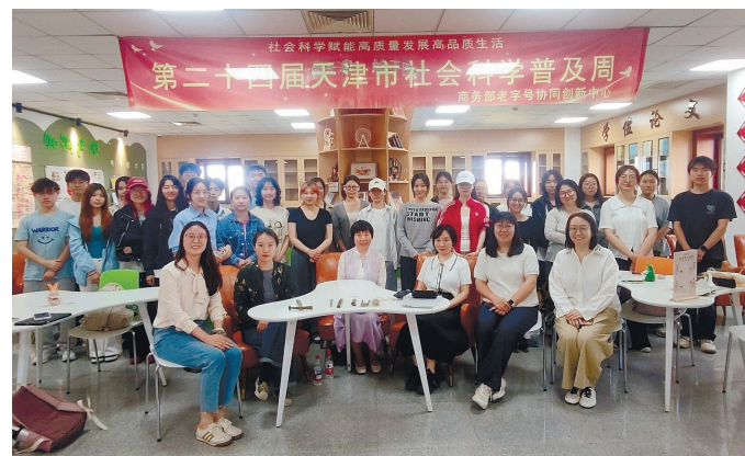
青年学子积极参与科普活动,近距离感受非遗魅力

日前,“老字号的非遗传承与企业创新”科普活动在天津商业大学举办,活动是天津市社会科学普及基地老字号协同创新中心推出的“津韵流长·青春接力”老字号科普系列活动的专题板块。该活动面向在校青年