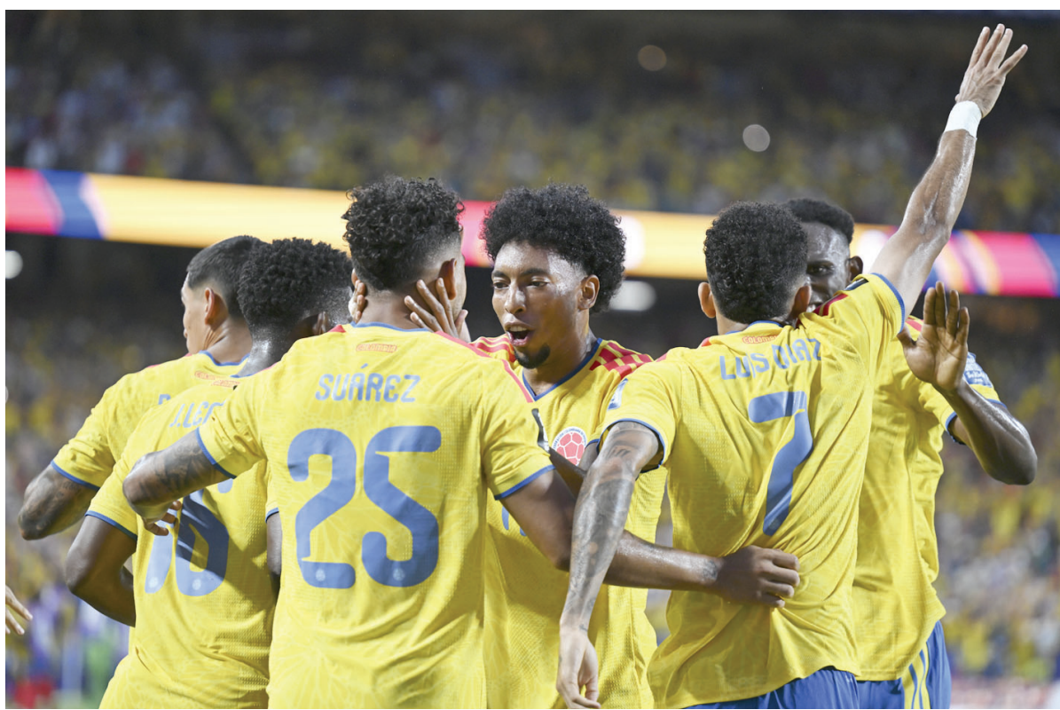
哥伦比亚队球员庆祝进球。

最晚进行的一场1/16决赛中,加纳队0比1不敌哥伦比亚队,无缘16强。数据显示,自2006年首次参加世界杯以来,加纳队对阵南美球队已经是4连败。其中3次是在淘汰赛阶段,除本场比赛外,还有2006年世界杯1/8决赛不敌巴西队,以及2010年世界杯1/4决赛输给乌拉圭队。 记者 王梓