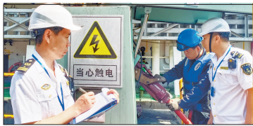
昨日,天津市政府新闻办召开新闻发布会,介绍《天津海事局服务港产城融合发展行动十项措施(2026版)》。