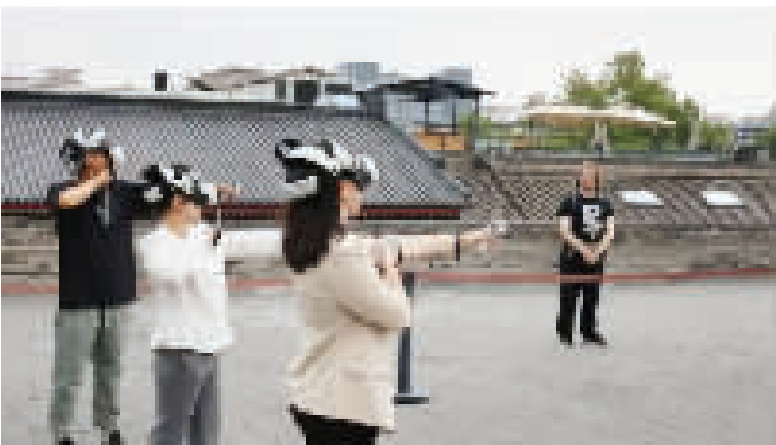
游客在西安城墙上体验一款以射箭守城为主题的MR混合现实游戏。

这些智能监测和人工测量的数据,全部聚拢在西安城墙数字方舱综合管理平台这一“数字大脑”中。赵彬说:“砖体0.1毫米的位移、墙体含水率的微小变化,都能转