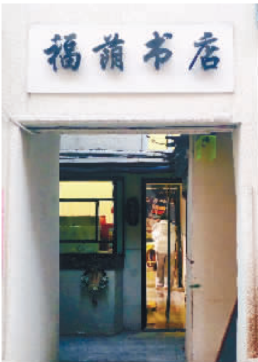
书店门头立街边,古朴中藏书香气。