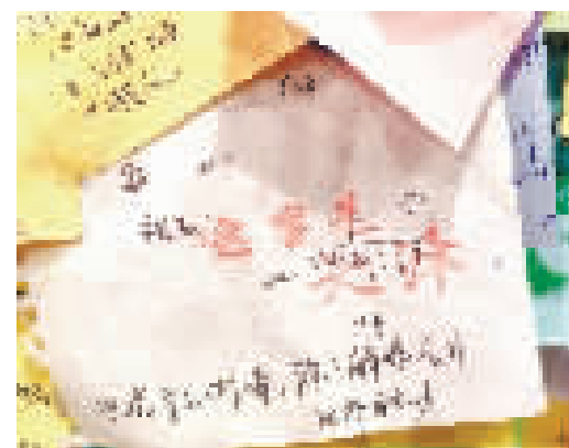
文稿写就廿载事,诚信初心从未改。