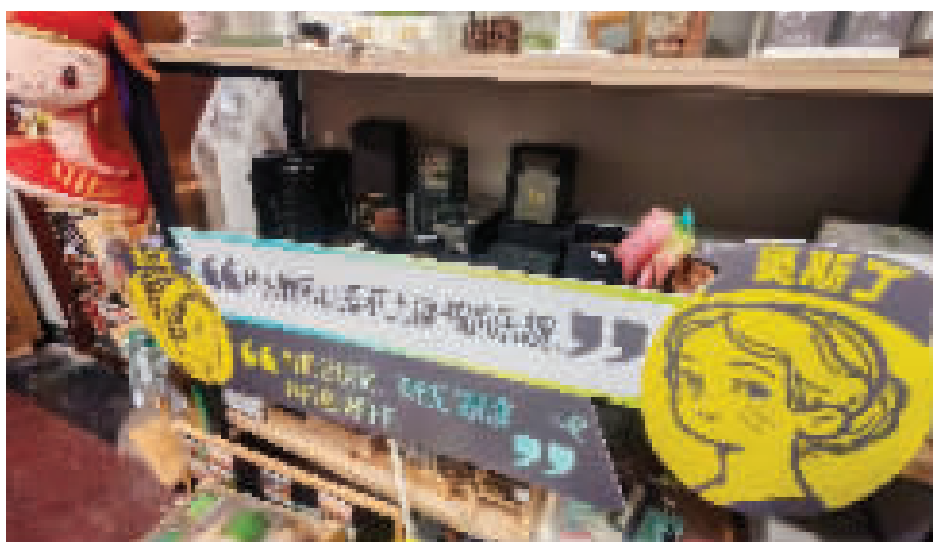
有趣的标语,是快乐阅读的开始。