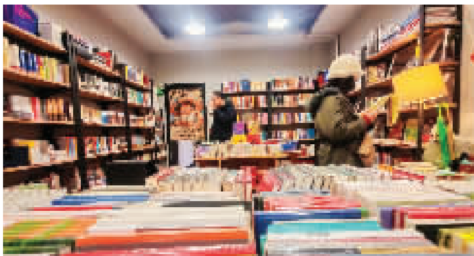
手捧书卷慢品读,无人书店享安宁。