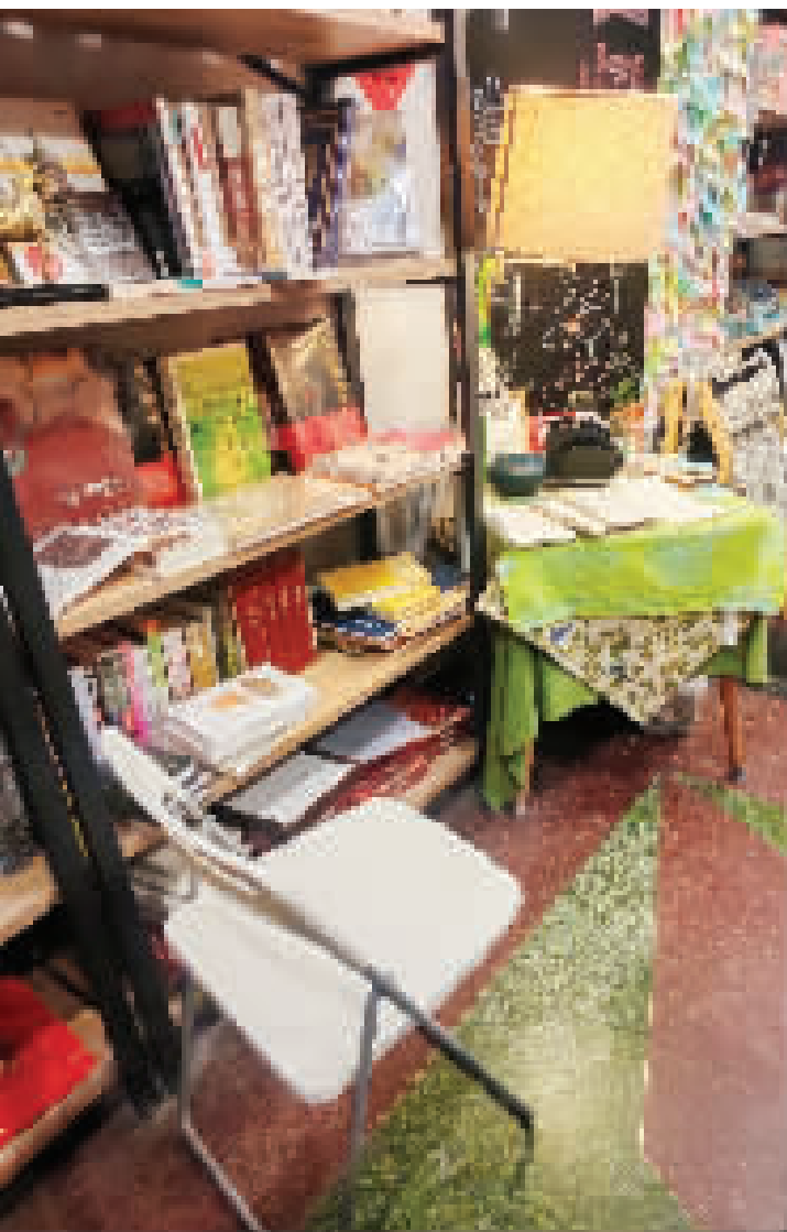
暖光轻洒书页间,书店静谧溢墨香。