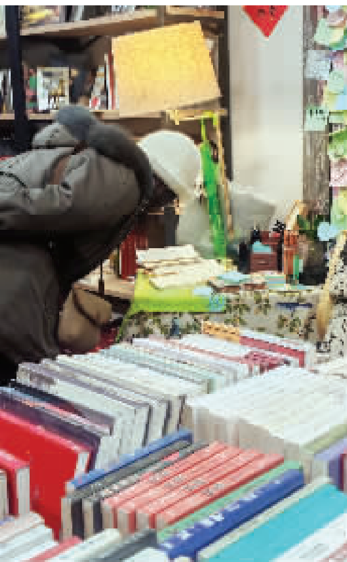
读者驻足书桌旁,静心翻书享时光。