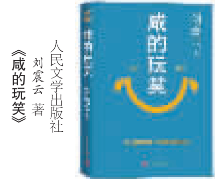
人民文学出版社 刘震云 著 《咸的玩笑》

剔肉边说:“啥事不能商量啊,拿刀动杖的。”杜太白嘴里又喊了一句:“啥事,都别惹我。”心里想,这是一箭三雕哇。事后又感慨,人为了爱情,容易把事做过。又想,过就过吧,谁让人有这点本能呢?(据《燕赵都市报》)