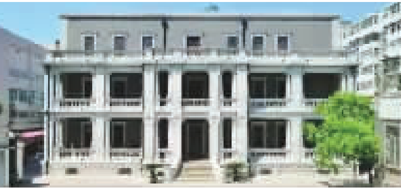
位于天津市和平区四川路2号的新云鹏旧居