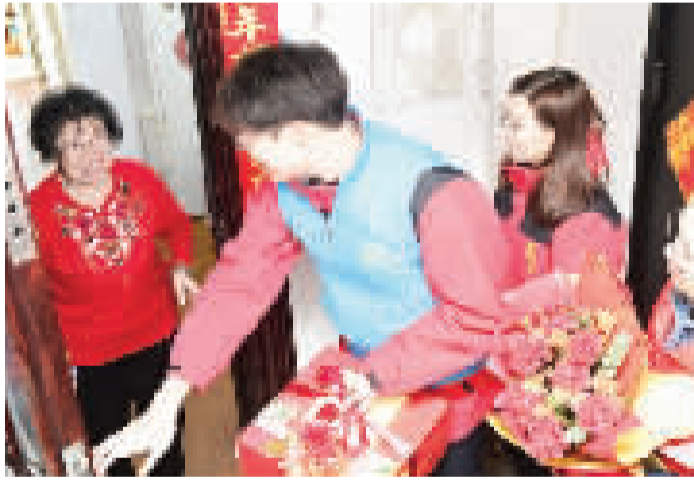
社区工作人员上门送祝福

现场,养老服务中心工作人员意为老人精心煮制长寿面,老人慢慢咀嚼,连连夸赞。社区工作人员还将象征吉祥安康的寿桃送到老人手中,声声祝福里满是对老人健康长寿的美好期许。老人精神矍铄,脸上洋溢着幸福满足的笑容。老人的儿子还拿出