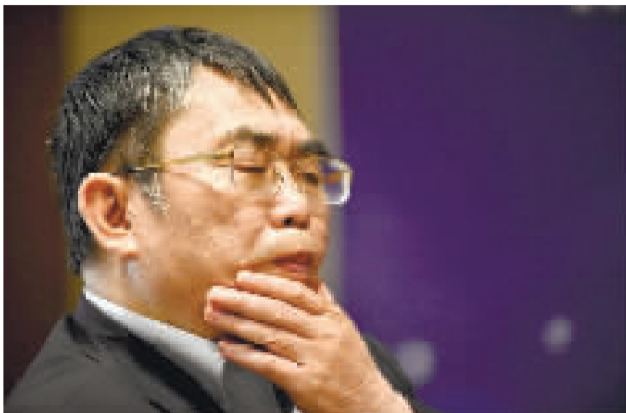
2019年10月23日，中国棋手聂卫平在2019年中韩围棋国手友谊赛中思考。

中国围棋协会名誉主席、“棋圣”聂卫平九段于1月14日在北京逝世，享年74岁。聂卫平是上世纪中国围棋振兴的关键人物，在八十年代的中日围棋擂台赛中，他作为主将力挽狂澜，连胜多位日本超一流棋手，创造了“擂台神话”，被当时的国家体委授予“棋圣”称号。