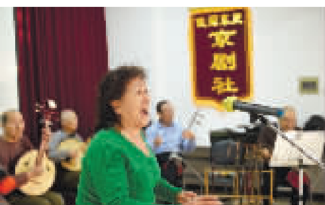
女团员演唱,众人围聚伴奏聆听。