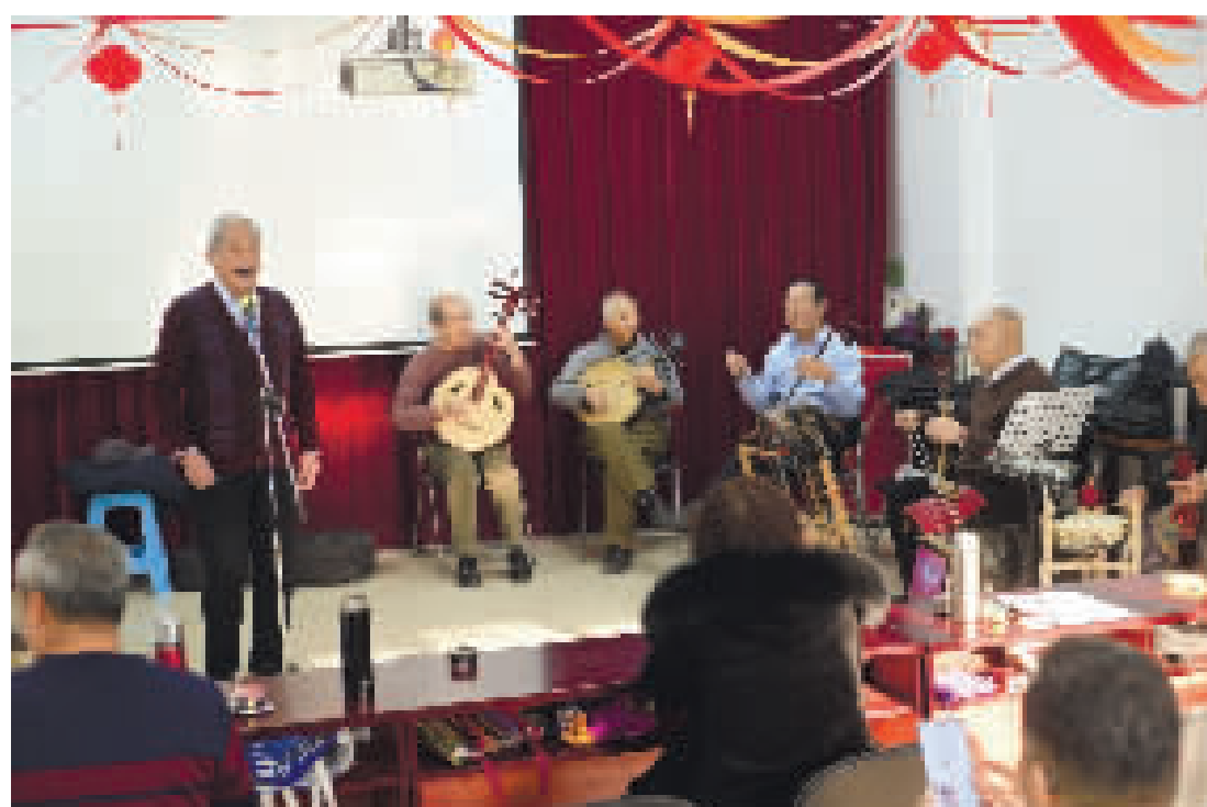
男团员全情投入演唱京剧。