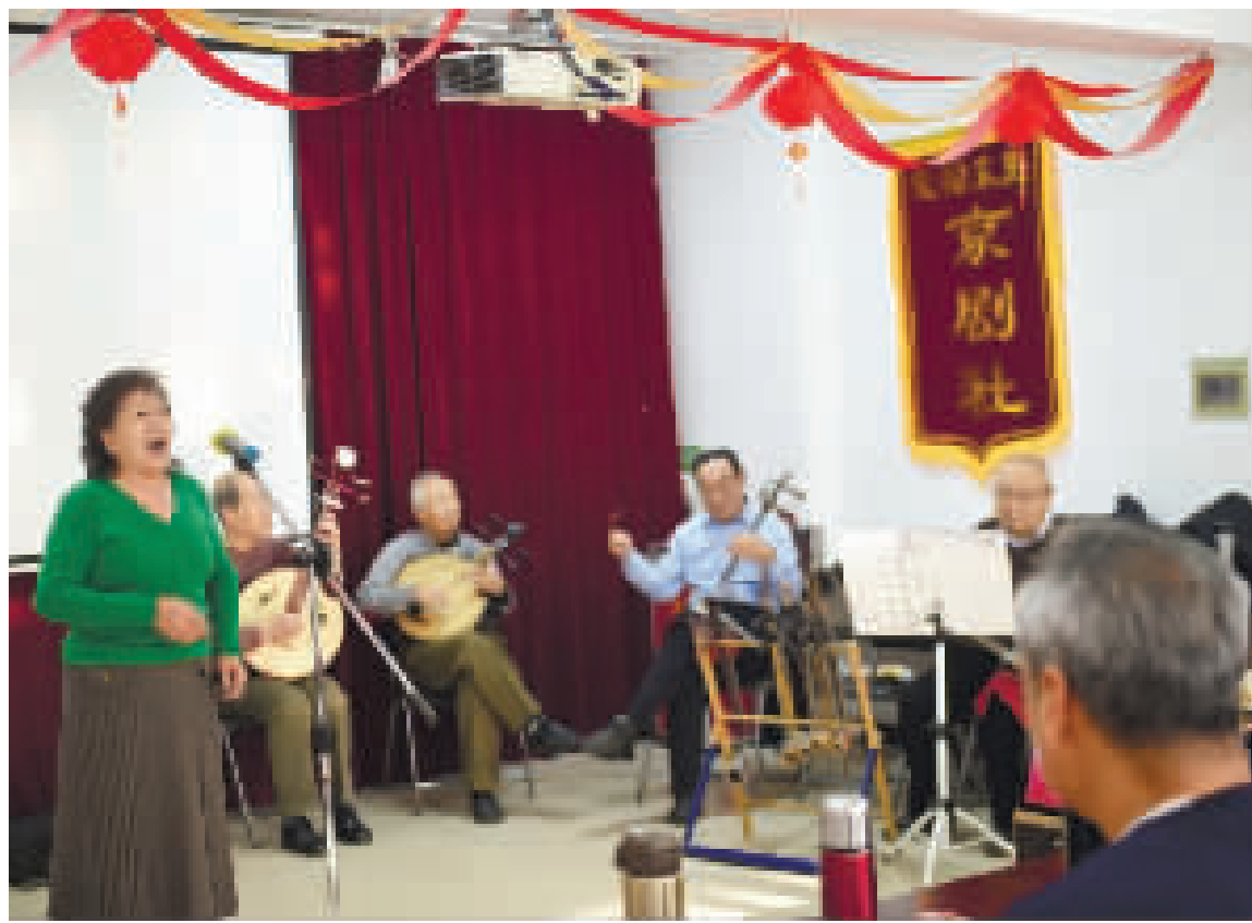
老伙计们围坐合奏,拉弦、弹拨的身影错落,丝竹声交织,让活动室变成热闹的临时戏台。