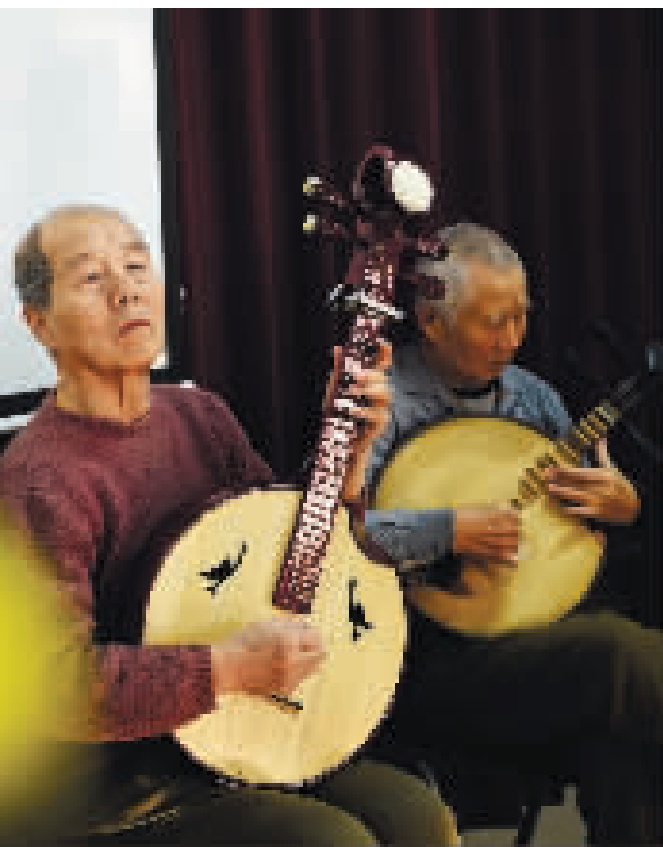
社团成员指尖轻拨月琴,弦音清亮婉转,为京剧演唱铺垫出悠扬的伴奏底色。