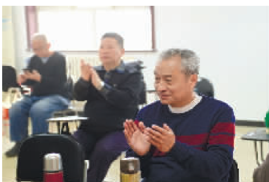
京剧班团员为队员鼓掌喝彩。