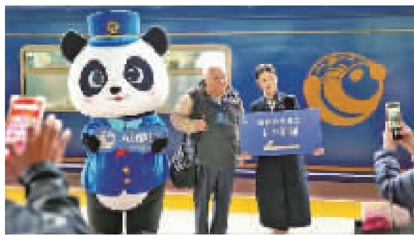
“熊猫专列”成都号旅客在安靖站站台上与“熊猫管家”合影