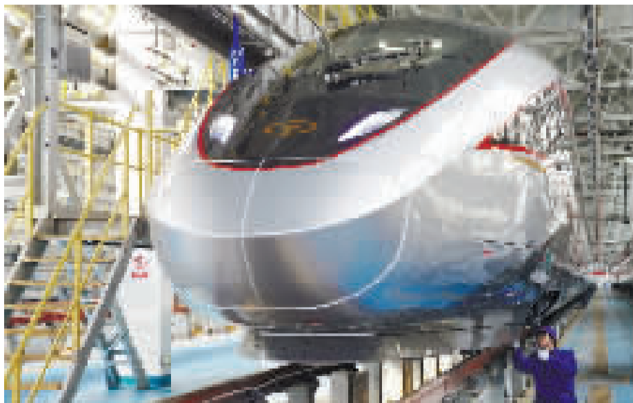
春运临近,中国铁路北京局集团有限公司北京动车段的工作人员在检修动车组列车。

至目前,出境游预订量前20位的国家中,“8小时飞行圈”及更长线的国家占比已超六成,土耳其、新西兰、俄罗斯等