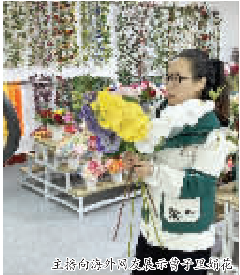
主播向海外网友展示曹子里绢花