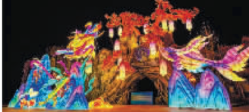
天津方特欢乐世界

即日起至3月8日,游客可前往天津方特感受年味,共赴一场惊喜连连的新春欢乐之旅。(据津云)