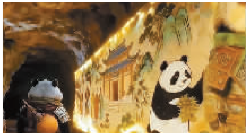
虚拟现实电影《山神熊猫之九州华藏图》面向公众开放体验

机,向海外观众推介影片拍摄取景地和故事发生地的景区景点,生动展示中国独特的电影魅力与丰富的旅游资源,吸引更多海外观众跟着电影镜头和中国故事来华旅游,领略中国春节文化的丰富多彩,感受中国自然风光、都市风貌和中式生活。