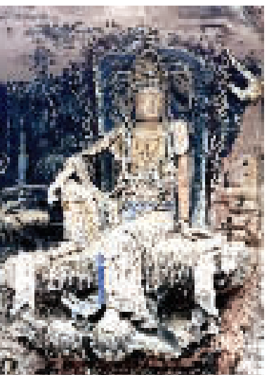
记者2025年12月4日在安岳县毗卢洞拍摄的紫竹观音造像。此造像被称为“东方维纳斯”。

这尊造像是安岳石窟的代表作,被称为“东方维纳斯”。1984年3月,著名英籍华裔作家韩素音专程来到四川安岳考察石刻,曾对紫竹观音赞叹道:“我到过许多国家,见过许多摩崖石刻艺术,像这样精美绝伦的还是第一次见到!”