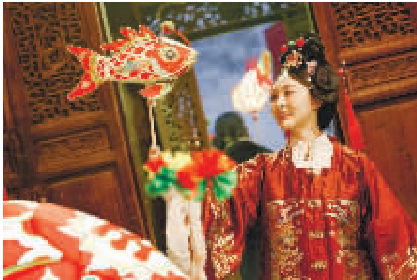
嬉鱼灯是徽州地区的传统民俗之一,每到新春时节,皖南古村鱼灯巡游,流光溢彩,吸引各地游客前来观赏体验。

在安徽省黄山市歙县,汪满田鱼灯、瞻淇鱼灯、渔梁鱼灯分别列入省、市、县级非物质文化遗产代表性项目名录。这些风格各异的鱼灯,共同构成歙县非遗鱼灯的鲜活图景。如今,鱼灯已从“乡土技艺”变为“文化IP”,当地除了传统的嬉鱼灯表演外,更串联起研学旅行、民宿餐饮、文创开发等业态。上图为在安徽省黄山市歙县北岸镇瞻淇村,游客手持鱼灯留影。