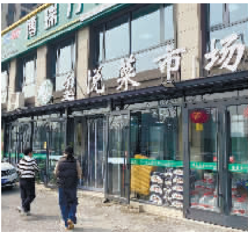
宝坻区玺悦菜市场