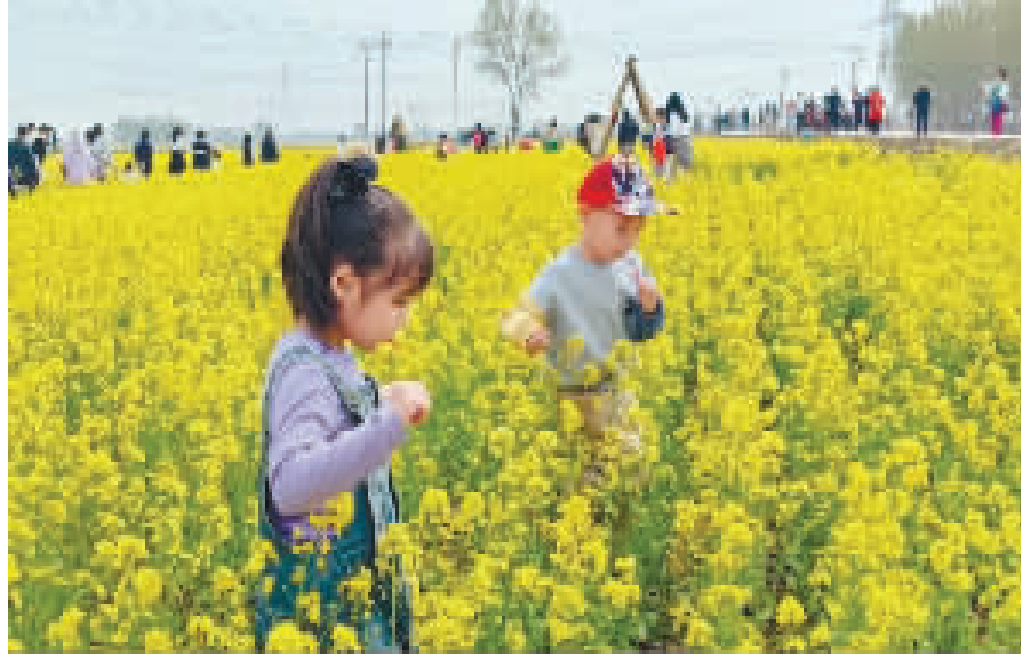
北辰区第四届“你好春天—花海踏青节”打造沉浸式田园春日盛宴