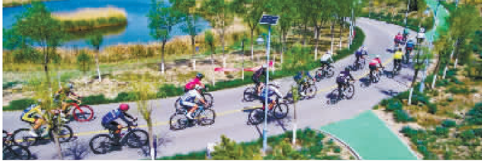
西青区王稳庄镇生态绿廊绿廊骑行赛现场