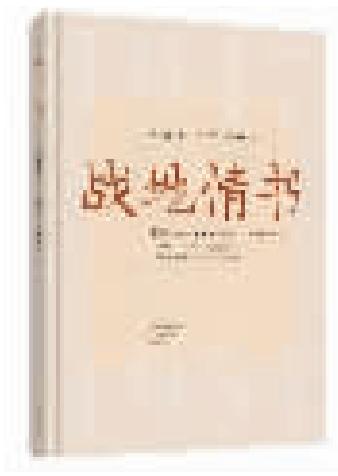
《战地情书》 宋云亮 著 张丁 张颖杰 编 河南文艺出版社出版

抢救民间家书的消息引起了多家媒体的强烈关注。2005年5月初,《南方周末》驻京记者石岩前来采访,我们给她推荐了胡阿姨寄来的4封家书。媒体报道持续发酵,央视《东方时空》栏目组也看中了家书素材,准备春节期间在新闻频道推出6集特别节目《家书故事》。宋云亮的情书故事有幸入选。2006年8月7日至10日,央视《东方时空·百姓故事》栏目连续4天播出了宋云亮和胡玉华的情书故事,题为《穿越硝烟》,他们的情书故事为更多的人所知晓。