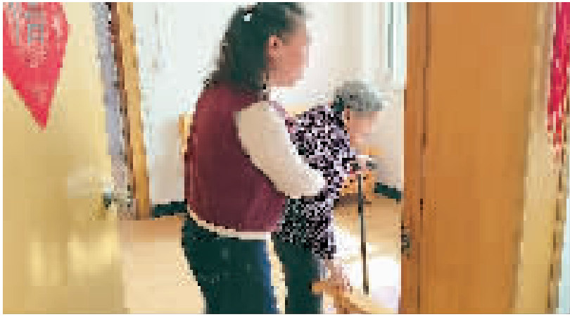
黄金花和养母在一起