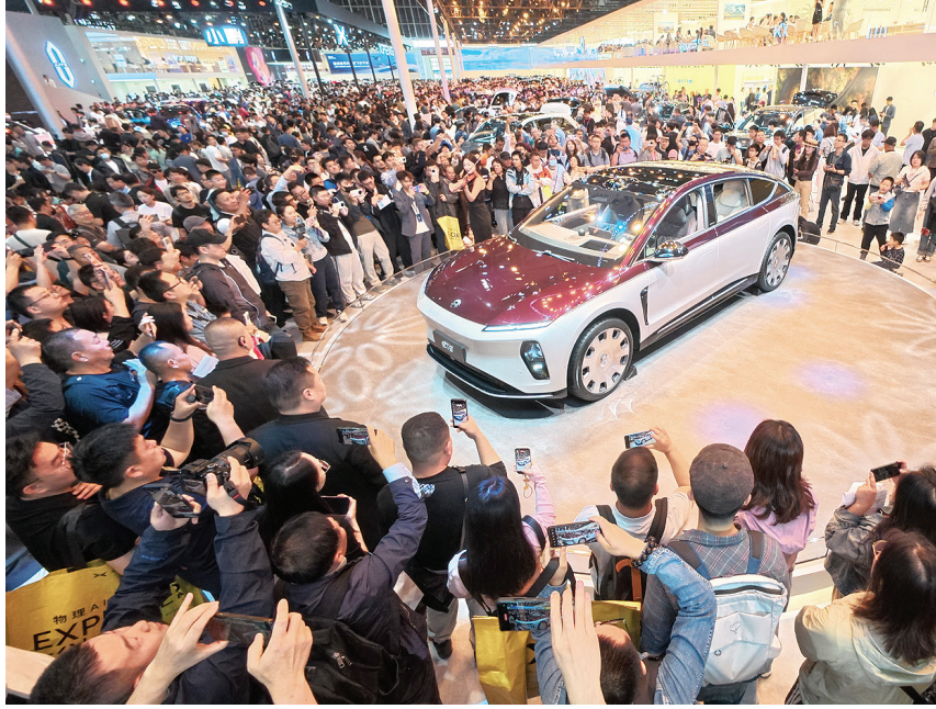
4月26日,2026(第十九届)北京国际汽车展览会迎来首个专业观众日,38万平方米的总展览面积、1451台展出车辆,其中181台首发车、71台概念车,吸引了众多参观者。