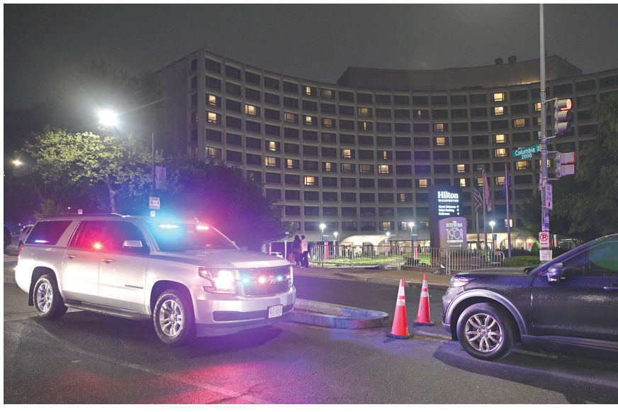
4月25日,警车停在美国华盛顿希尔顿酒店前。