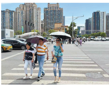
5月10日,市民在北京朝阳区街头打伞防晒。

不过,比起眼前的短暂炎热,很多人还担忧今年夏天的高温。近日,网络上关于“今夏将迎来史上最热夏天”的传闻传播度很高,引发了网友关注。对此,中国气象局发文进行了解读。