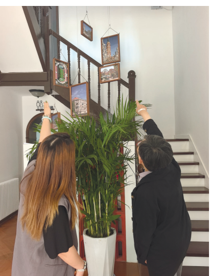
游客参观三盛里社区党群服务中心

紧挨着的“便民巧将工坊”,像一个社区工具箱。居民家里的拉链坏了、头发该理了,或临时需要扳手、胶布,都能来这里寻求帮助。社区联动商户和志愿者,把小修小补难题就地解决。