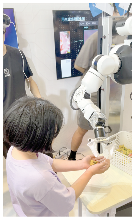
孩子们在智博会现场与机器人互动

周六闭幕的2026世界智能产业博览会昨日举行公众开放日活动,现场热闹非凡,俨然成了一个充满未来感的“亲子科技乐园”。由于临近“六一”儿童节,众多亲子家庭迫不及待地来到这里,提前开启了一场别开生面的科技狂欢。大朋友、小朋友们穿梭在各个展台之间,玩得不亦乐乎,笑声和惊叹声此起彼伏。