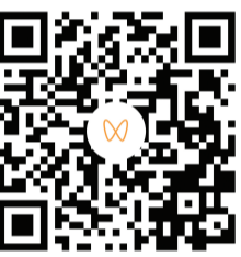
扫码观看 现场视频