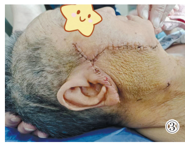
图②、图③:患者术前术后对比照片。