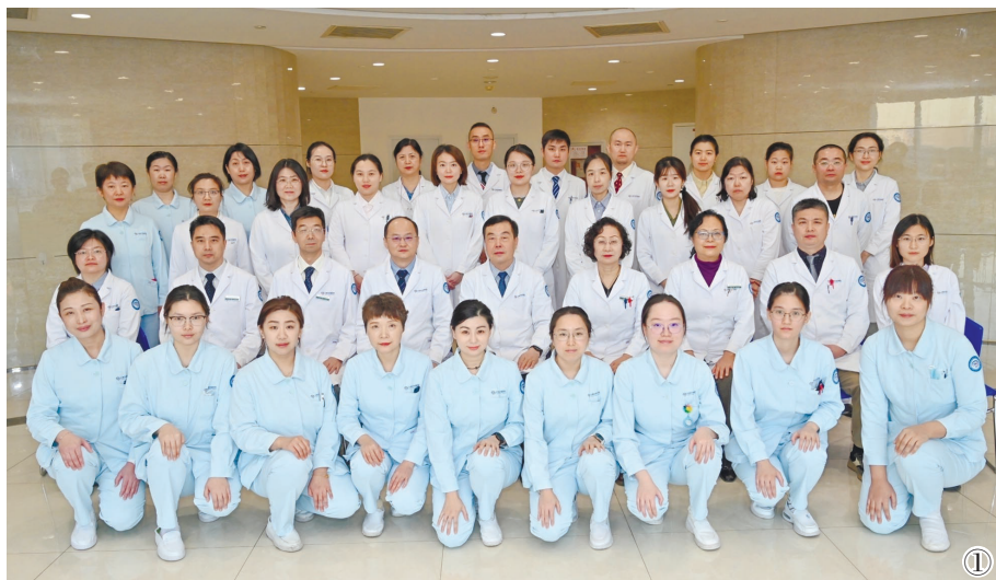
图①:此次手术的团队合照。

良性肿瘤五年潜伏，一朝疯长酿成致命危机。77岁高龄老人因为一个小小的腮腺混合瘤逐渐膨大至排球大小，危及生命。近日，天津市环湖医院启动多学科协作(MDT)诊疗模式，多科室专家联动、跨院名医助阵，历经三小时精细手术，完整摘除巨大肿瘤，同时完好保留面部神经，配合精细化术后护理，让老人重获新生。